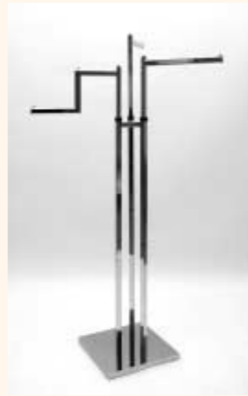
Quadra 3 Fußplatte 400 x 400 mm, 3 Arme einzeln höhenverstellbar H: 1250/1970 mm B: 800 mm Art. 6605