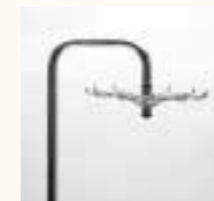
Tragarm mit Drehkranz Art. 3642