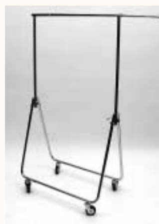
Reiserrollständer mit 2 Auszieharmen Rollen: ø 80 mm zusammenlegbar H: 830/1500 mm B: 820/1380 mm Art. 3604