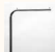
Tragarm gerade Art. 3634