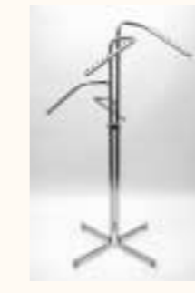
Vierarmständer schräg mit Stellfüßen höhenverstellbar H: 1100/1750 mm Art. 3611