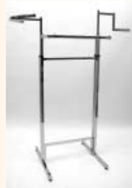
Quadra 2 Gondelset mit 2 Rahmen, 2 Arme einzeln höhenverstellbar Art. 6607