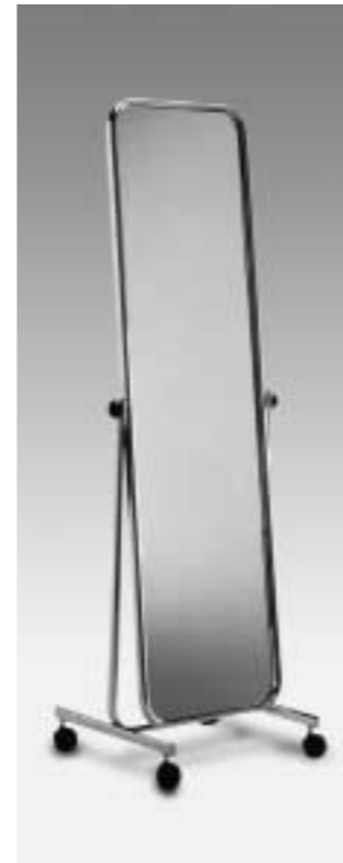
Standspiegel schwenkbar mit Rollen Art. 3647