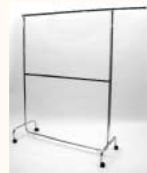
Rollständer mit 2 Auszieharmen und Zwischenstange H: 1050/1935 mm B: 1000/1765 mm Art. 6621