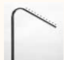
Tragarm schräg Art. 3635