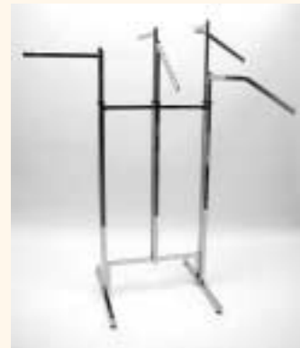
Quadra 2 Gondelset mit Zwischenstange und 6 Armen einzeln höhenverstellbar Art. 6615