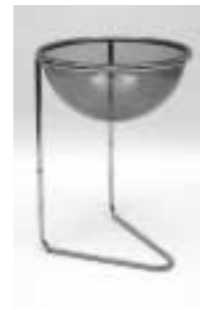
Verkaufschale Rundrohrgestell Plexischale klar ø 500 mm H: 750 mm Art. 3629

ohne Abb. Plakatrahmen für Art. 3629 Art. 3638