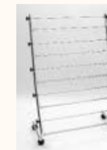
Schuhständer mit 5 Konsolen 800x190 mm H: 1200 mm B: 800 mm Art. 3627