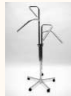
Vierarmständer schräg Fußkreuz mit Rollen Arme einzeln höhenverstellbar H: 1100/1700 mm Art. 6611