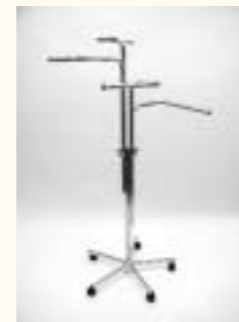
Vierarmständer gerade Fußkreuz mit Rollen Arme einzeln höhenverstellbar H: 1100/1700 mm Art. 6610