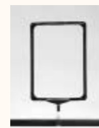
Plakatrahmen A4 für Rollständer chrom, weiss 220 x 310 mm Art. 3601