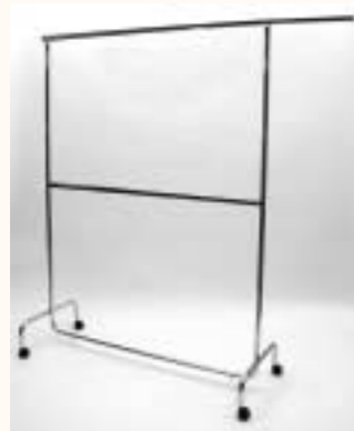
Rollständer mit 2 Auszieharmen und Zwischenstange H: 1050/1935 mm B: 1400/2200 mm Art. 6622