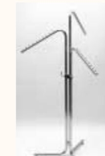
Dreiarmständer schräg mit Stellfüßen höhenverstellbar H: 1100/1750 mm Art. 3631