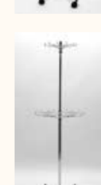
Gürtel-/Krawattenständer mit 1 Ring: ø 410 mm höhenverstellbar H: 1200/2200 mm Art. 3624