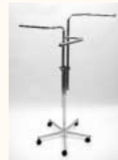
Dreiarmständer gerade Fußkreuz mit Rollen Arme einzeln höhenverstellbar H: 1100/1700 mm Art. 6613