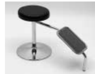
Schuhanprobensitz Kunstleder, schwarz H: 440 mm B: ø 350 mm T: 780 mm Art. 3645