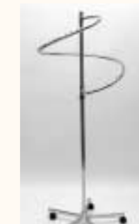
Spiralständer 43 Stopper H: 1800 mm Art. 3614