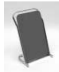
Schuhspiegel H: 600 mm B: 400 mm T: 270 mm Art. 3639