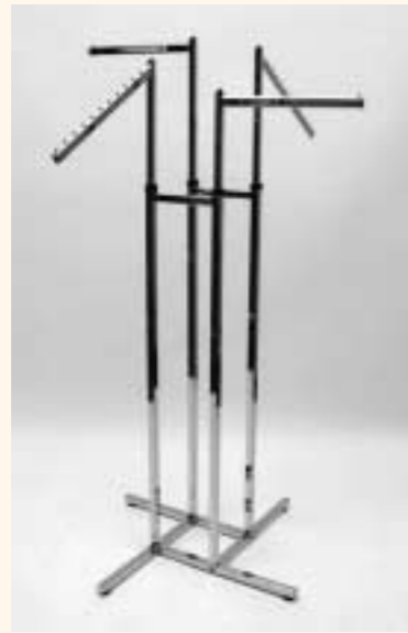
Quadra 4 Kreuzfußständer mit 4 Armen einzeln höhenverstellbar H: 1250/1970 mm B: 800 mm Art. 6604