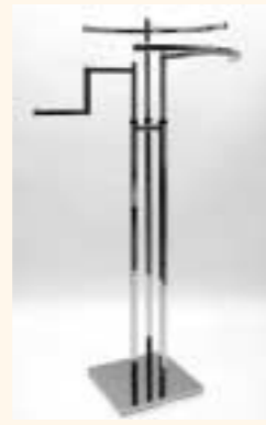
Quadra 3 Fußplatte 400 x 400 mm mit 3 Armen einzeln höhenverstellbar Art. 6619