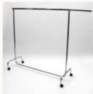
Rollständer mit 2 Auszieharmen H: 1490 mm B: 1440/2200 mm Art. 3605