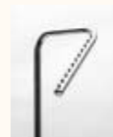
Tragarm, gebogen schräg Art. 3641