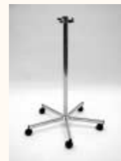
Grundelement für 3 Tragarme Art. 3633