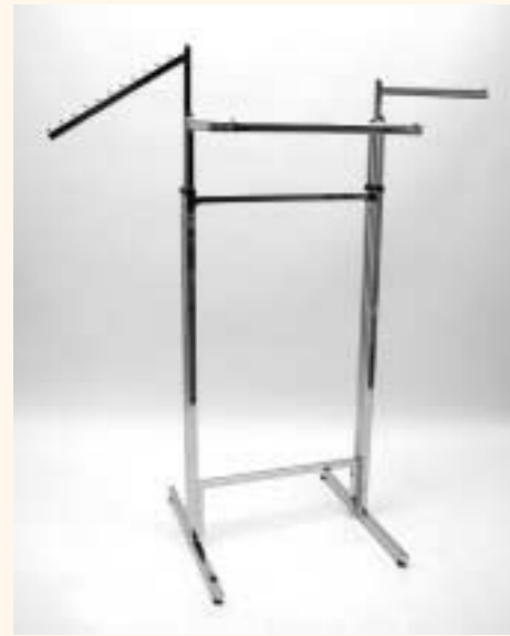
Quadra 2 Gondelset mit 2 Rahmen, 2 Arme einzeln höhenverstellbar H: 1250/1970 mm B: 700/650 mm Art. 6603