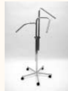
Dreiarmständer schräg Fußkreuz mit Rollen Arme einzeln höhenverstellbar H: 1100/1700 mm Art. 6612