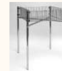
Verkaufskorb Rundrohrgestell Korb: 650 x 650 x 200 mm H: 750 mm Art. 6401