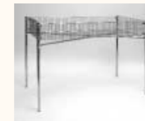
Verkaufskorb Rundrohrgestell Korb: 1250 x 650 x 200 mm H: 750 mm Art. 6402