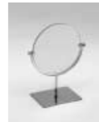
Kosmetikspiegel schwenkbar Art. 3649

Phillips System GmbH & Co. KG für Laden- und Messebau