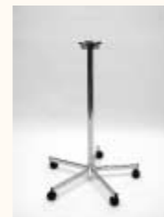
Grundelement für 4 Tragarme Art. 3632