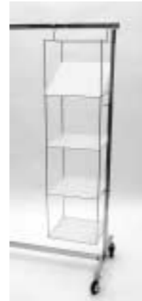
Ablage für Rollständer zum Einhängen H: 1300 mm B: 320 mm T: 320 mm Art. 3610

ohne Abb. Plakatrahmen für Art. 3629 Art. 3638