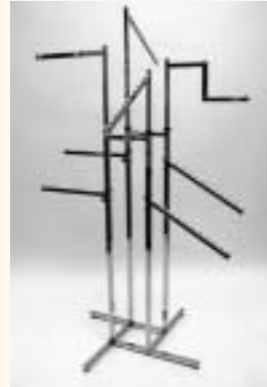
Quadra 4 Kreuzfußständer mit 4 Armen 4 Anschraubarme einzeln höhenverstellbar Art. 6608