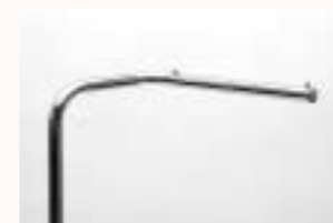
Tragarm gebogen Art. 3640