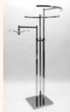
Quadra 3 Fußplatte 400 x 400 mm mit 3 Armen einzeln höhenverstellbar Art. 6609