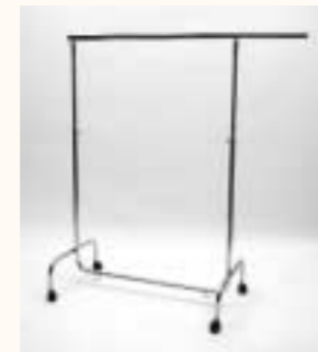
Rollständer mit 2 Auszieharmen höhenverstellbar H: 1415/2005 mm B: 1000/1765 mm Art. 3609