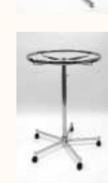
Ringständer Ring ø 800 mm höhenverstellbar H: 1100/1850 mm Art. 3680