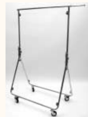
Reiserrollständer mit 2 Auszieharmen Rollen: ø 80 mm zusammenlegbar H: 1560 mm B: 985/1550 mm Art. 3626