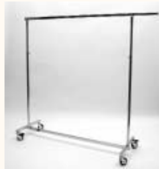
Reiserrollständer mit 2 Auszieharmen Rollen: ø 80 mm zusammenlegbar höhenverstellbar H: 1330/2175 mm B: 1435/2170 mm Art. 3603