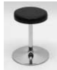
Hocker Kunstleder, schwarz H: 440 mm B: ø 350 mm Art. 3646