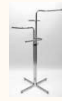
Vierarmständer gerade mit Stellfüßen höhenverstellbar H: 1100/1750 mm Art. 3621