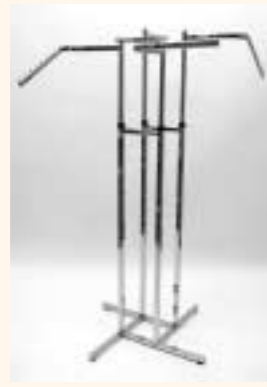
Quadra 4 Kreuzfußständer mit 4 Armen einzeln höhenverstellbar Art. 6618