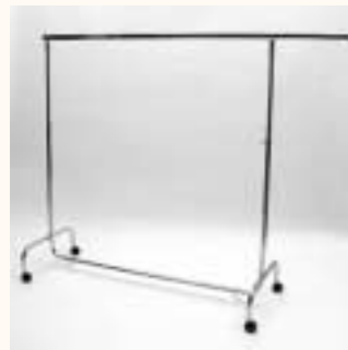
Rollständer mit 2 Auszieharmen höhenverstellbar H: 1405/1995 mm B: 1440/2210 mm Art. 3606