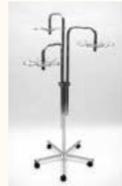
Dreiarmständer mit Drehkränzen Fußkreuz mit Rollen Arme einzeln höhenverstellbar H: 1100/1700 mm Art. 6614