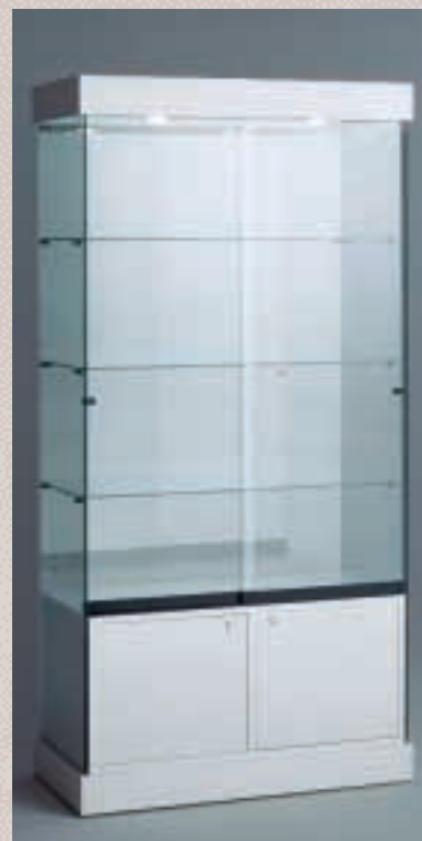
Art. 7535 Standvitrine Modell 121/BS

H: 188 cm B: 92 cm T: 46 cm Laminat weiß, 2 Strahler