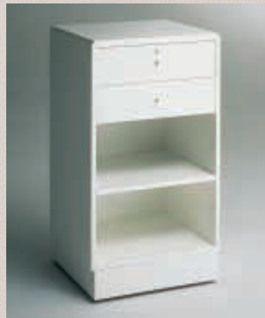
Art. 7541 Theke Modell 162/M

H: 90 cm B: 50 cm T: 46 cm Laminat weiß, 2 Schubladen (eine davon abschließbar)