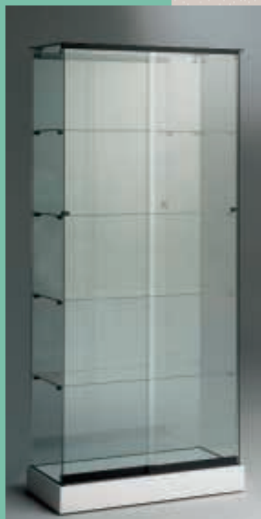
Art. 7533 Standvitrine Modell 130/CS

H: 198 cm B: 69/44 cm T: 47 cm MDF schwarz oder weiß lackiert, 2 Strahler, Spiegelrückwand