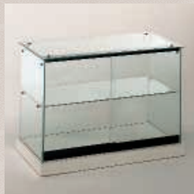
Art. 7543 Tischvitrine Modell 190/B

H: 74 cm B: 31 cm T: 31 cm MDF weiß, Glasdrehböden, elektr. Antrieb, 2 Strahler