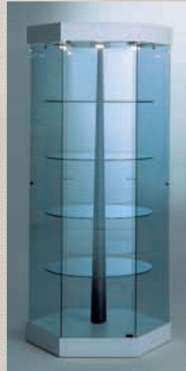
Art. 7538 Sechseckvitrine Modell 201/R 84

H: 188 cm B: 52 cm T: 46 cm Laminat weiß, 1 Strahler