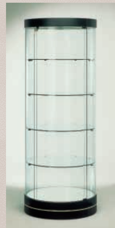
Art. 7547 Rundvitrine Modell 231/TS

H: 188 cm B: 92 cm T: 46 cm Laminat weiß, 2 Strahler