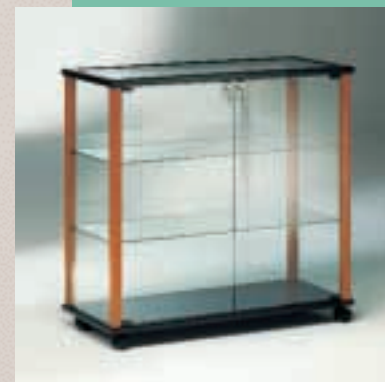
Art. 7546 Thekenvitrine Modell 90/LD

H: 92 cm B: 97 cm T: 40 cm mit Holzprofil Nußbaum/schwarz