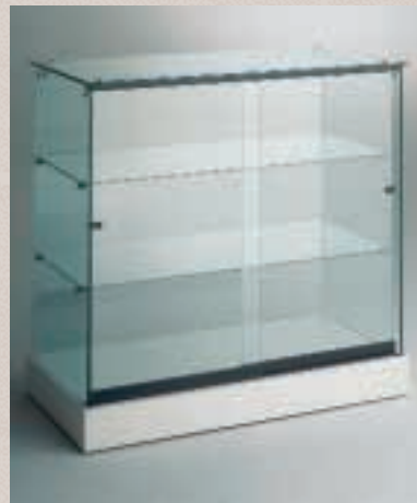
Art. 7540 Thekenvitrine Modell 20/AS

H: 90 cm B: 50 cm T: 46 cm Laminat weiß, 2 Schubladen (eine davon abschließbar)