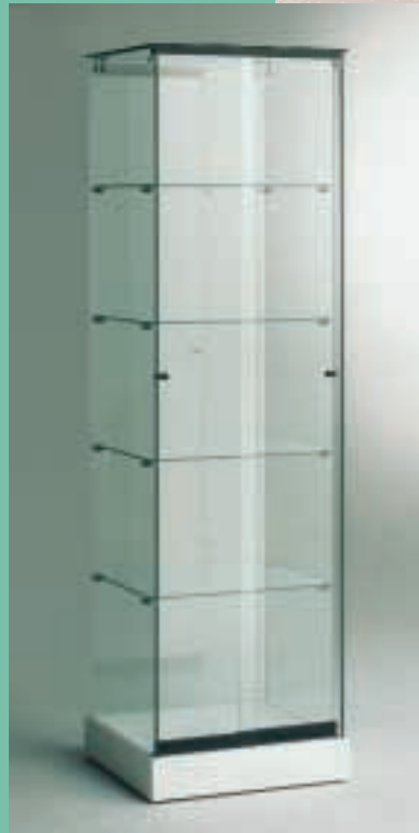
Art. 7530 Standvitrine Modell 180/ES

H: 180 cm B: 52 cm T: 46 cm Laminat weiß