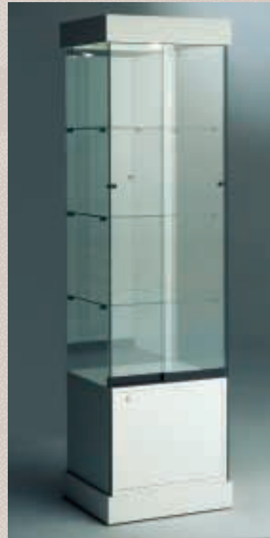
Art. 7532 Standvitrine Modell 171/DS

H: 188 cm B: 52 cm T: 46 cm Laminat weiß, 1 Strahler