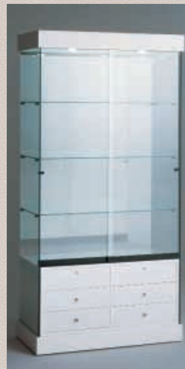
Art. 7536 Standvitrine Modell 101/BS

H: 188 cm B: 92 cm T: 46 cm Laminat weiß, 2 Strahler