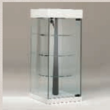
Art. 7548 Tischvitrine Modell 201/RQ

H: 74 cm B: 31 cm T: 31 cm MDF weiß, Glasdrehböden, elektr. Antrieb, 2 Strahler