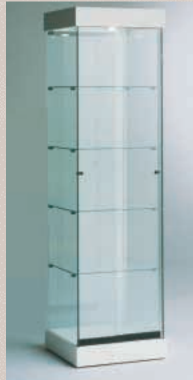
Art. 7531 Standvitrine Modell 181/ES

H: 180 cm B: 52 cm T: 46 cm Laminat weiß