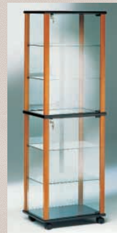
Art. 7545 Standvitrine Modell 51/LD

H: 190 cm B: ø 71 cm MDF schwarz, Spiegelboden, 2 Strahler, staubgeschützt