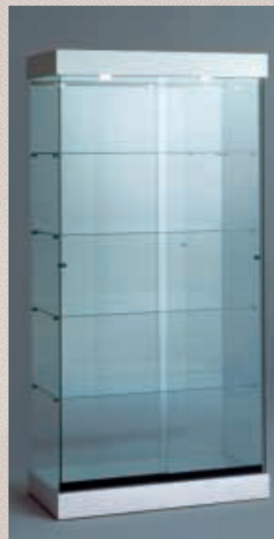
Art. 7534 Standvitrine Modell 131/CS

H: 180 cm B: 92 cm T: 46 cm Laminat weiß