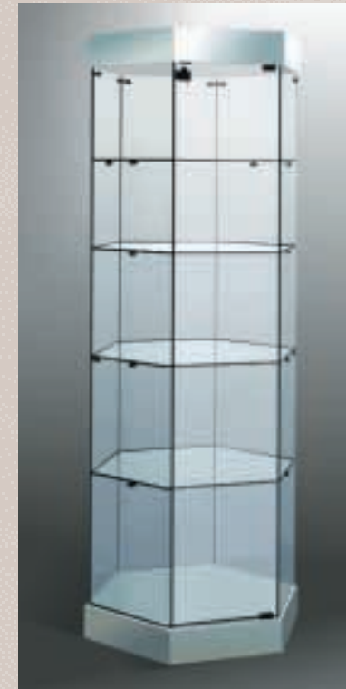
Art. 7537 Sechseckvitrine Modell 201/R 70

H: 187 cm B: 95 cm T: 84 cm Laminat weiß, Glasdrehböden 60 cm ø, elektr. Antrieb, 4 Strahler, auf 6 Rollen